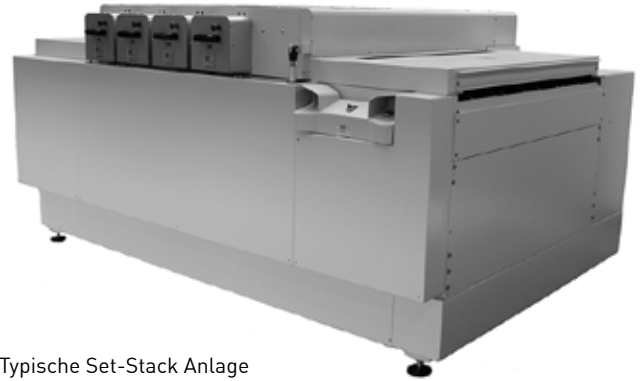
Typische Set-Stack Anlage