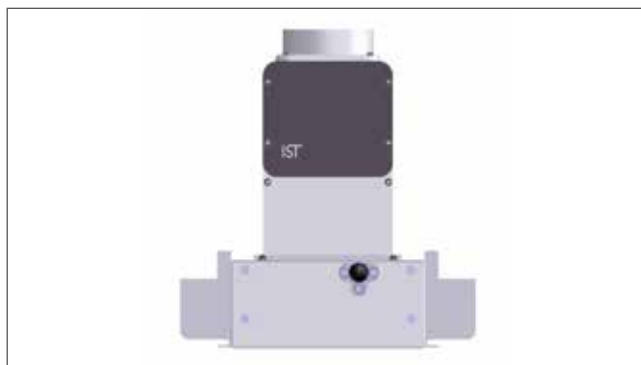
System IST UV MBS®-LI, instalacja z optymalną ochroną przed promieniami UV